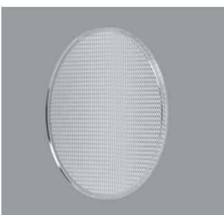
70861.000 Spherolitlinse wallwash aus optischem Polymer. Werkzeuglos wechselbar.