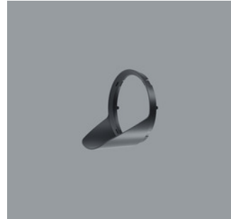
70634.000 Snoot Kunststoff. Schwarz