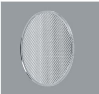
73997.000 Spherolitlinse extra wide flood aus optischem Polymer. Werkzeuglos wechselbar.