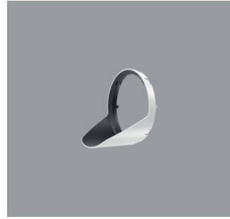
70710.000 Snoot Kunststoff. Weiß